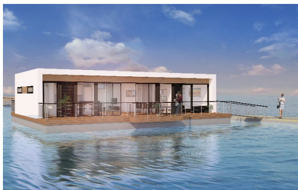
Eksempel på planlagt husbåd