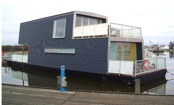
Husbåde i 2 etager, Bork Havn (illustration: Hvide Sande Seasight)