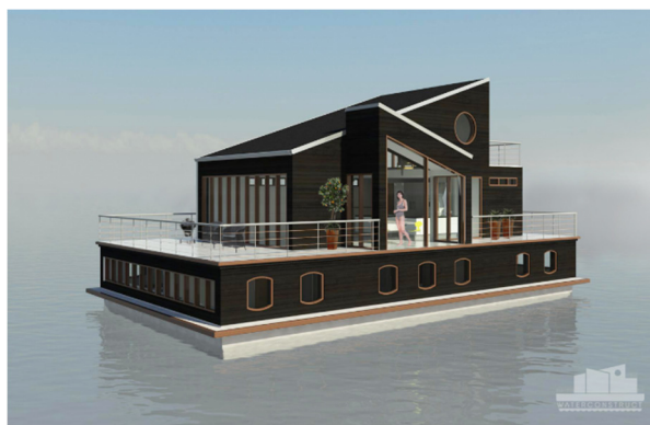
Planlagt husbåd Holbæk (illustration: Waterconstruct og Schou Birkendorf arkitekter)