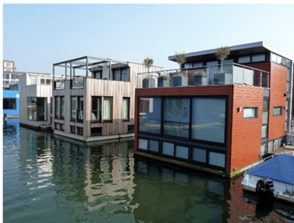
Eksempler på store husbåde med "kælder", IJburg i Amsterdam

Marina City skal være et bæredygtigt byområde, og der lægges vægt på at også husbådene bliver bæredygtige og miljørigtige med hensyn til f.eks. materialer, indeklima, energiforsyning, vedligeholdelse osv.