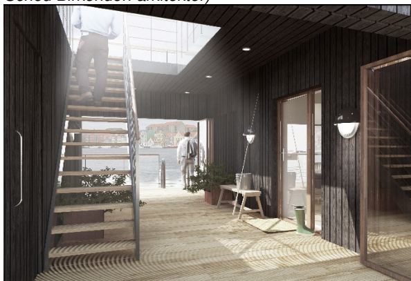
Vision Water Cube (illustration: AFLOAT A/S og KANT arkitekter)