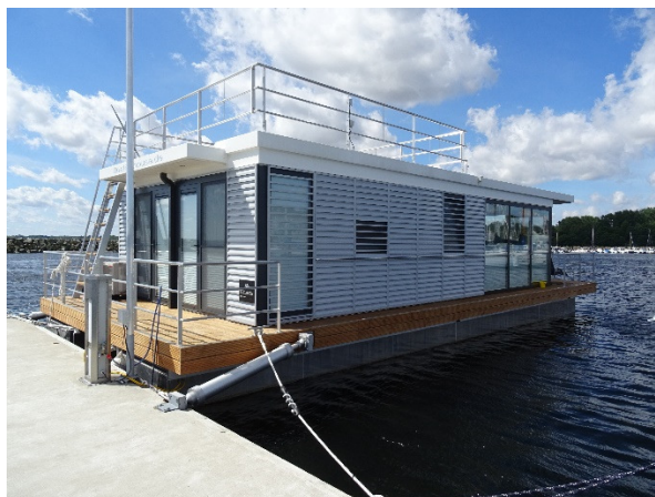
Eksempel på lille husbåd, Boltenhagen i Tyskland